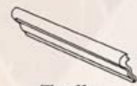
Torello 6x20 cm - 2"x8"