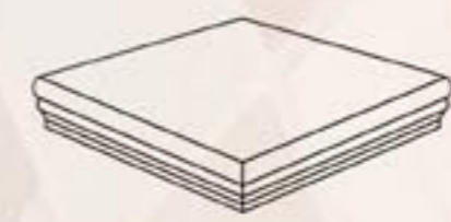
Angolare 20x20 cm - 8"x8"