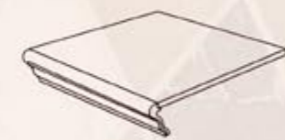
Gradino 20x20 cm - 8"x8"